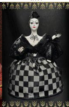
Шахматная королева, 2009