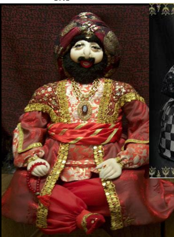
Скупой султан, 2004 г