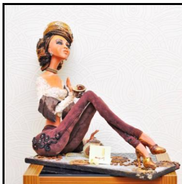
Женщина с ароматом кофе, 2016