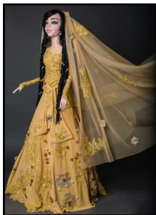
Невеста в золотом