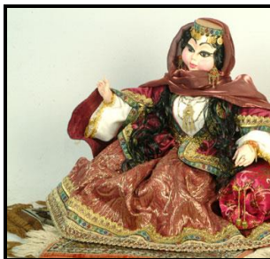
Шахризад, 2004 г