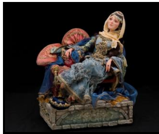
Зажиточная ханум Мензер