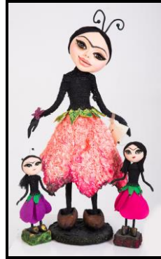
Из детской сказки «Тух-Тух ханым»