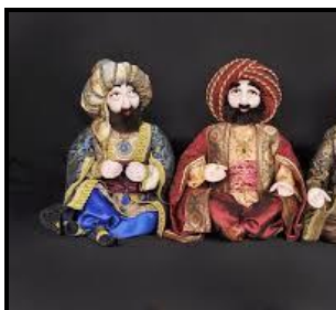
Султан и два его визиря, 2011 г