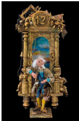
Часовщик и время