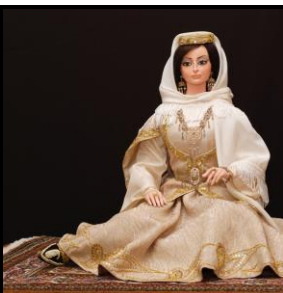
Мехрибан Алиева, Фонд Г. Алиева, 2012