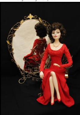
Софи Лорен, 2016