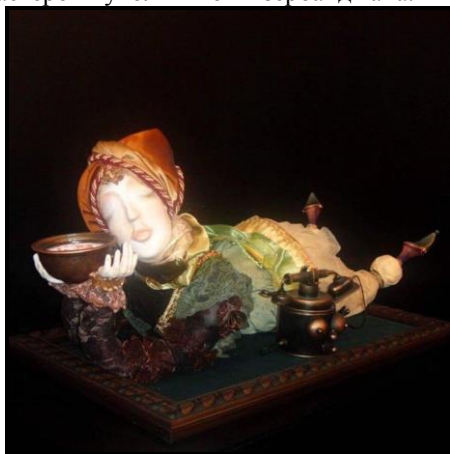
Спящий ангел, 2016

Выводы. Подытоживая вышесказанное, можно сделать следующие выводы: перечисленные известные и талантливые мастера-кукольного искусства в Азербайджане заявили о себе большими творческими возможностями и потенциалами. Их кукольное искусство стало известно далеко за пределами Азербайджана. Каждая их кукла отражает их внутренний мир, опирается на национальные традиции и преемственность декоративно-прикладного искусства Азербайджана, храня за собой соответствующие символы. Современное декоративно-прикладное искусство в Азербайджане: объёмная художественная миниатюра, авторские художественные куклы созвучны времени и отражают успехи этих мастеров.