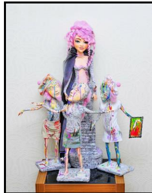
Девичья башня, 2016