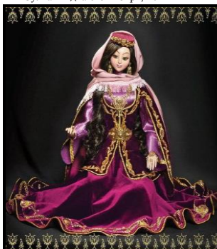
Капризная невеста, 2009