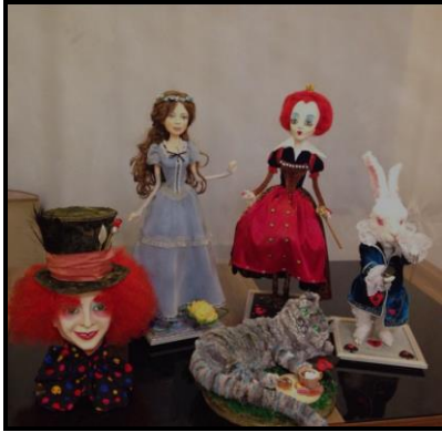
Алиса в стране чудес 2016