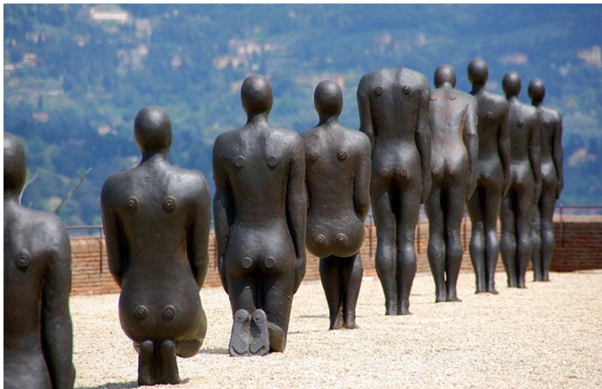
Antony Gormley, the exhibition «Human», Florence 2015 1