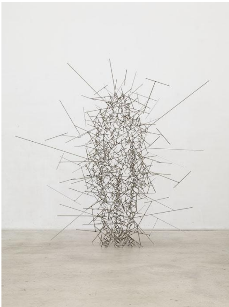
Antony Gormley, sculpture «Quantum Void», London 2008 1