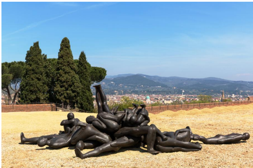
Antony Gormley, the exhibition «Human», Florence 2015 1